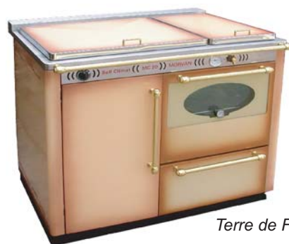
Terre de France

Un couvercle calorifugé est livré de série avec la cuisinière MC 20. Il est très apprécié car il réduit le chauffage rayonné de la MC 20 quand on souhaite privilégier le circuit de chauffage central pour la diffusion des calories. De plus sa forme douce et sa couleur émaillée sont en parfaite harmonie avec la MC 20.